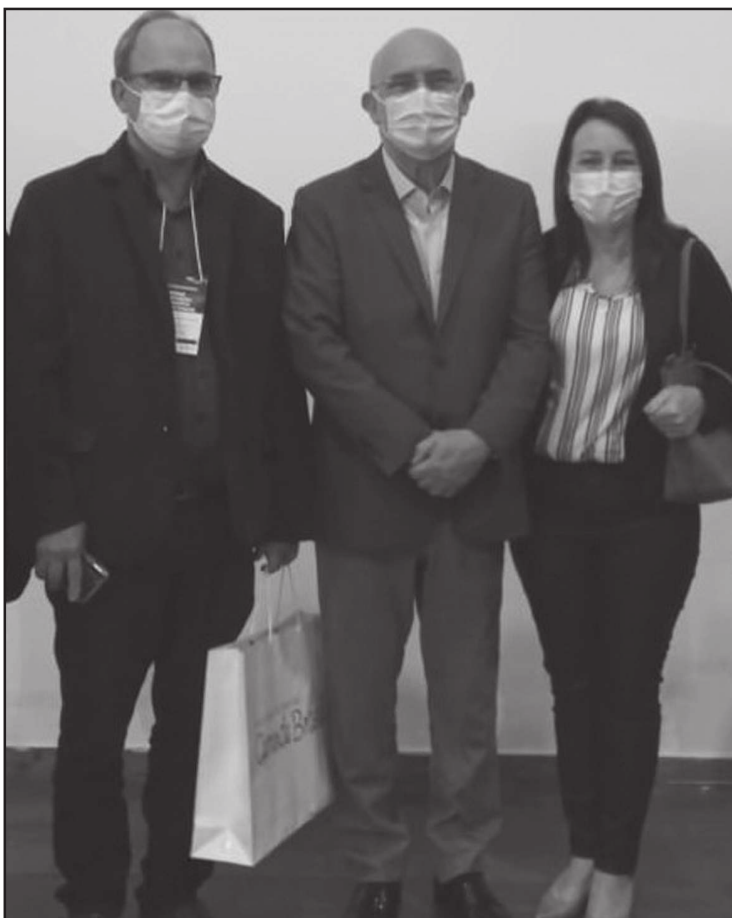
Prefeito Municipal, Ministro da Educação e Secretária de Educação

A Secretária de Educação destacou que o encontro foi excelente para conhecer projetos e esclarecer dúvidas de programas e políticas públicas que o MEC disponibiliza para os municípios.